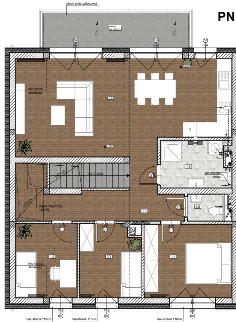
Rzut piętra +1